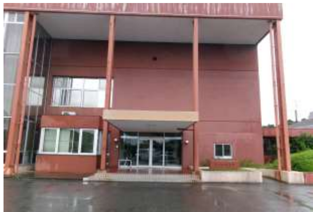
—築 46 年、雨もりする村体育館—

今号は 9 月 10 日～12 日に開かれた議会の報告です。認定 5 件、報告 3 件、同意案件 1 件、議案 9 件が提案され全て承認可決しました。また、令和 5 年度の決算は決算審査特別委員会に付託され、石井の一般質問は①小高村長の公約について②村体育館の補修について③安心安全な道路づくりでした。